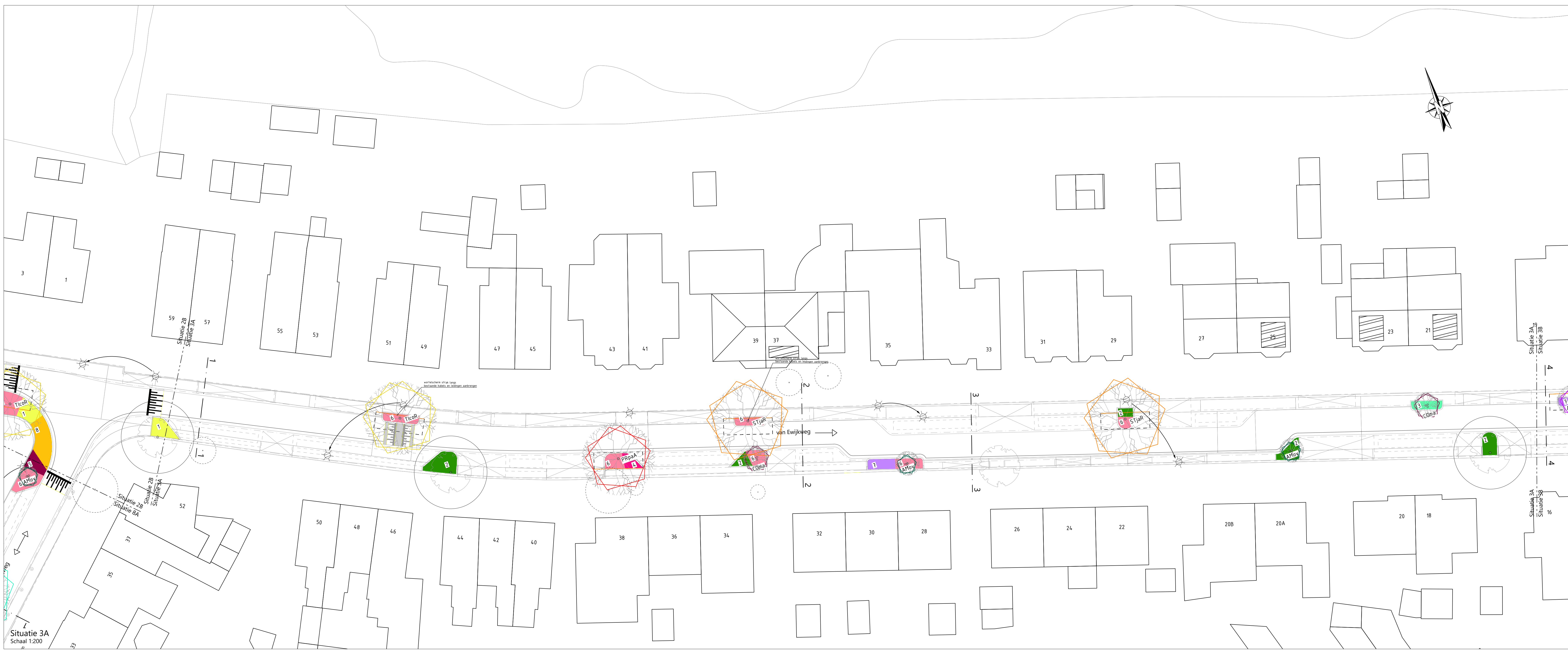
Situatie 3A Schaal 1:200