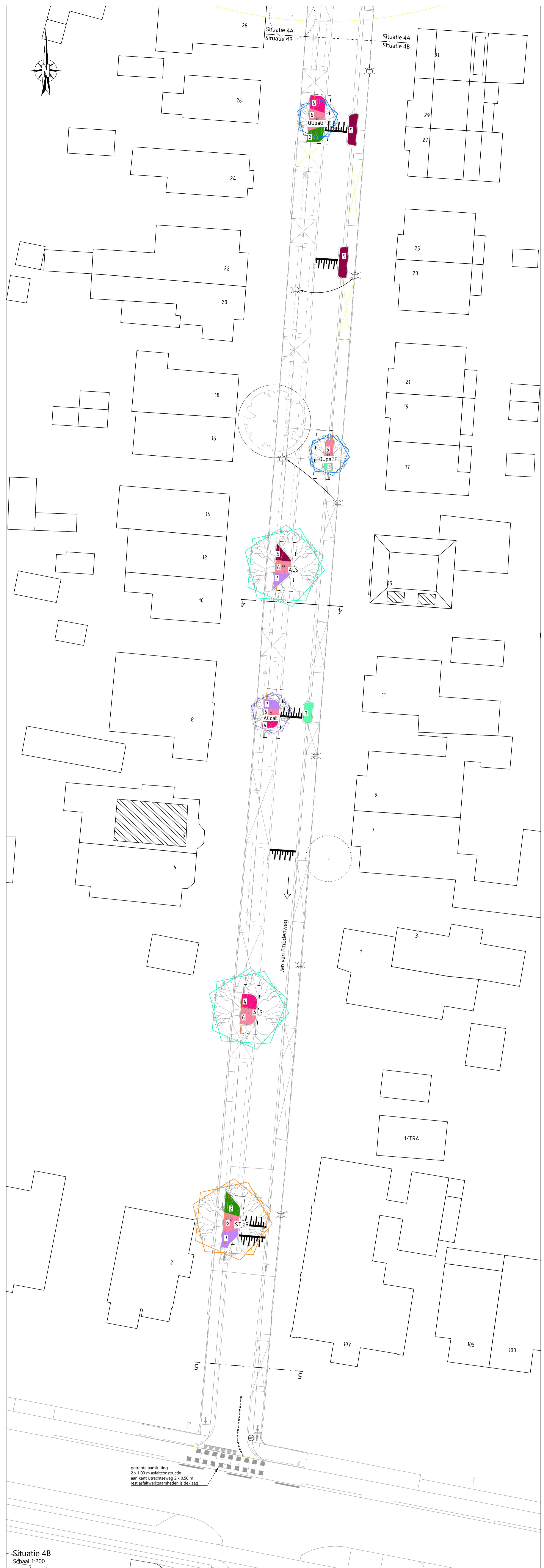
Situatie 4B Schaal 1:200