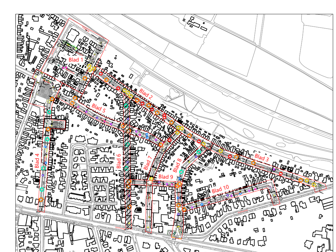
overzicht bladindeling niet op schaal