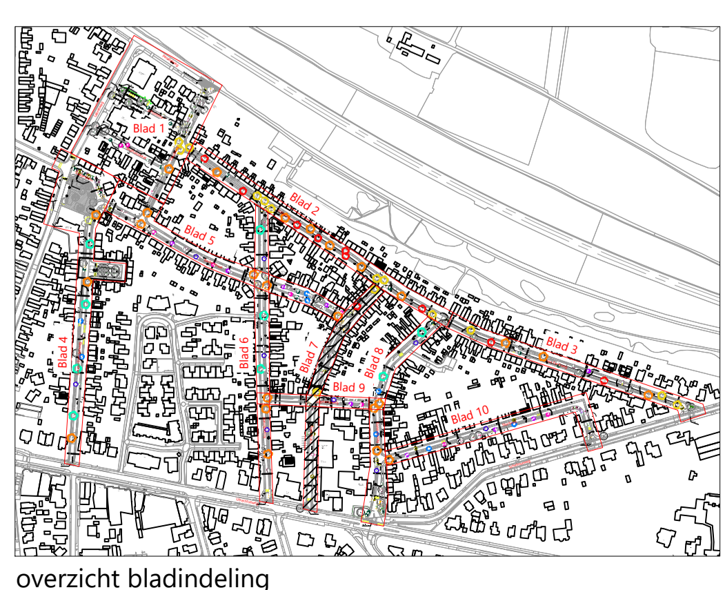
overzicht bladindeling niet op schaal